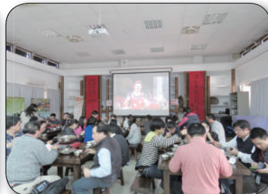
1/19環保署環教場所座談記者會，火鍋宴