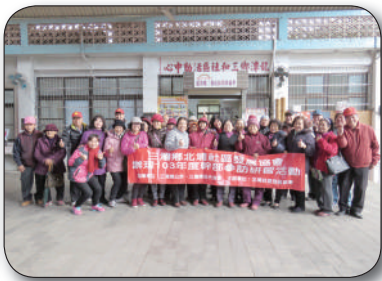
12/17苗栗縣三灣鄉北埔社區參訪，聽取簡報、意見交流