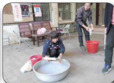
1/19環保署環教場所座談記者會，炒花生體驗、社造訪談、造紙體驗活動