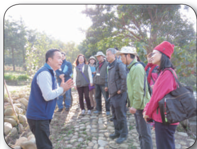
書面資料審查、三元宮導覽、疊疊樂教學