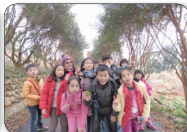
12/20桃園縣高原國小，步道趴趴GO導覽體驗活動