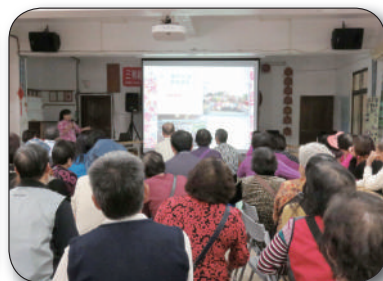
12/7桃園縣蘆竹市海湖村環保志工隊參訪，聽取簡報、意見交流