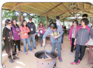
2/13新北市政府環保局，步道趴趴GO導覽、炒花生糖體驗活動