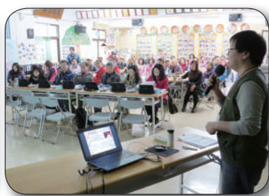
社區手鼓隊迎賓、評審委員介紹、社區簡報