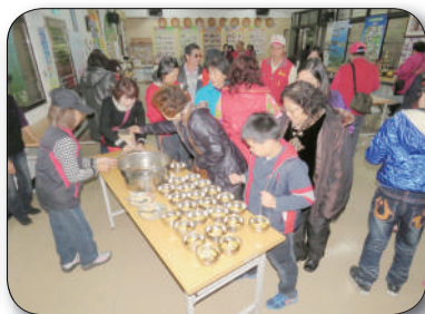
12/14桃園縣龜山鄉兔坑社區參訪，聽取簡報、客家點心品嚐