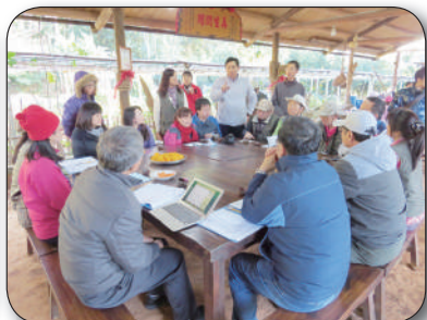
環教人員導覽、米食DIY體驗、意見交流