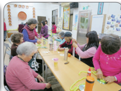
黃春菊總幹事協助安排杯墊DIY教學課程，教導如何將廢棄光碟片再利用