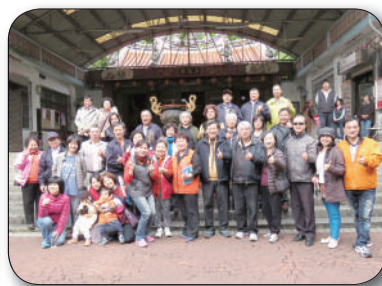
12/11台中市北區區公所參訪，聽取簡報、意見交流