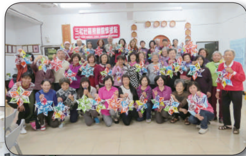
聖誕雪花製作教學