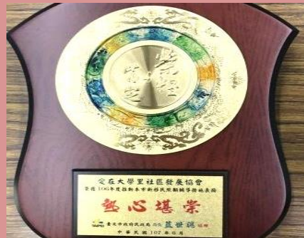
新移民照顧輔導措施表揚