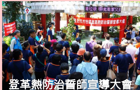
登革熱防治誓師宣導大會