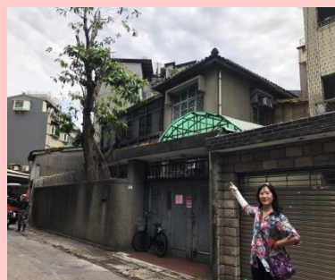
閒置空間樹木修剪