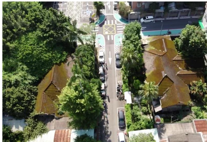
▲溫州街52巷兩處日式建築群

107年7月30日，台北市政府二樓202室文化局官員與相關局處、專業人員、團體代表與民眾在這討論著閒置空間列冊相關事宜，因此，就以溫州街52巷這群日式建築其部分閒置空間而言，本著里長職務帶領在地居民爭取都市再生活化事項，已爭取到繼續列冊配合市政府各局處政策，期盼將來能規劃出大學里都市