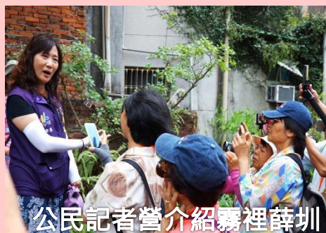
公民記者營介紹霧裡薛圳