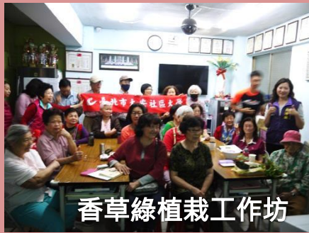
香草綠植栽工作坊