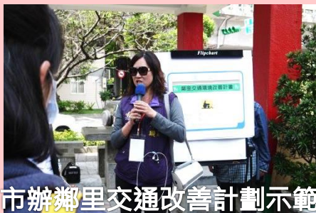
市辦鄰里交通改善計劃示範