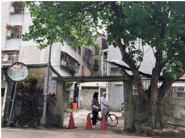
▲羅斯福路3段283巷29弄轉角

107年7月30日，台北市政府二樓202室文化局官員與相關局處、專業人員、團體代表與民眾在這討論著閒置空間列冊相關事宜，因此，就以溫州街52巷這群日式建築其部分閒置空間而言，本著里長職務帶領在地居民爭取都市再生活化事項，已爭取到繼續列冊配合市政府各局處政策，期盼將來能規劃出大學里都市