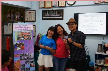
趣味攝影 記者就是你