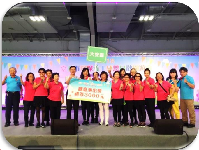
▲大會頒發大學里環保啦啦隊「創意演出獎」殊榮。

幾天過後，報名環保啦啦隊的成員已達20名，隔週隨即展開第一次的訓練，由零落的舞步、散散的口號在真理堂一樓逐步形成，從稍具樣貌，很快地在最後一次練習，隊員們終於排練完成大學里環保啦啦隊的舞步、隊呼與口號。