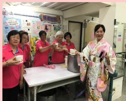
端午節社區成果展