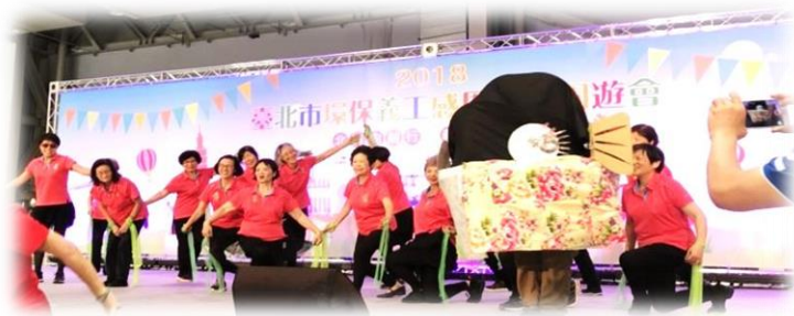
▲大學里環保啦啦隊精彩演出。

週六早上，環保資源回收站的任務正在進行，堆積如山的資收物永遠收不完，右前方傳來里長的聲音說：「我們來組環保啦啦隊，為環保做宣傳，一起愛護地球」。這時，多數的里民心中存著疑慮你一句我一句地說：「組環保啦啦隊!?要排練跳舞、要有隊呼、要喊口號，我們會組得成嗎？」。