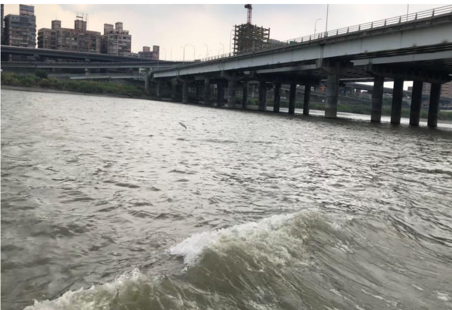
▲藍色公路魚躍水間身影。

藍色公路： 午後，車行一上洲美高架道路、關渡平原隨即呈現眼前，車行大度路時，安全島上的佳荖樹，迎風招展，20年前、整治愛國東西路時、將安全島上的佳荖樹移植此地，如今生機蓬勃、樹如有情、樹亦欣喜。