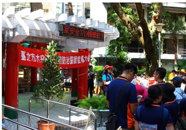
▲左圖為溫州公園舉辦大安區登革熱防治誓師宣導大會。

回家後我們帶著孫子先把家中的青花瓷大花盆裏的水清理乾淨！環境衛生遠離疾病！今天上了有意義的一課。