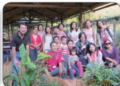
10/29大華國小，步道導覽、炒花生糖體驗活動