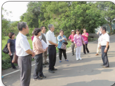
戶外環境實地現勘，環教人員協助導覽