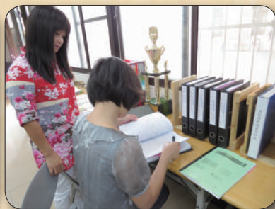
103年度社區關懷據點評鑑