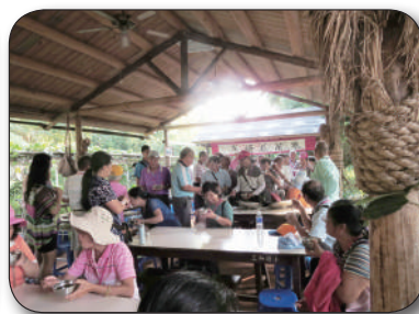
10/2苗栗縣竹南鎮公所參訪，聽取簡報、步道導覽、享用客家點心