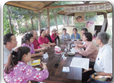
綜合座談，意見交流