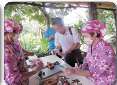
志工媽媽米食體驗教學