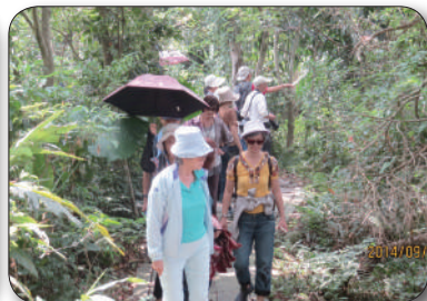
9/29新竹市銀髮族協會，步道導覽、炒花生體驗活動