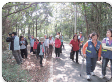
11/5桃園縣蘆竹市巡守隊參訪，聽取簡報、米食體驗、步道導覽、低碳風味餐