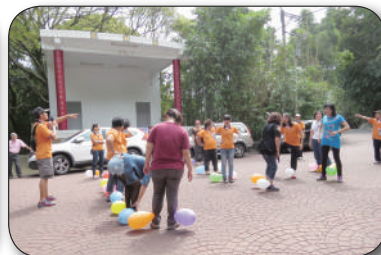
10/5平鎮市後備憲兵荷松協會淨山活動，步道導覽、米食體驗、風味餐