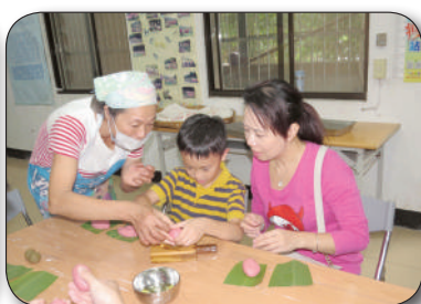
10/5學知出版社，三和叛米食DIY體驗活動