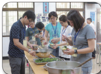
9/4台中市政府文化局參訪，聽取簡報、步道導覽、享用社區低碳風味餐