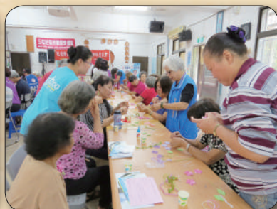
龍潭鄉婦女會團隊協助胸針DIY教學課程