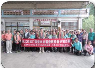
11/30新北市林口區雙林社區參訪，聽取簡報、意見交流