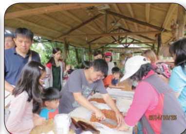
10/25新竹科學園區管理局，步道導覽、低碳風味餐、炒花生糖體驗活動