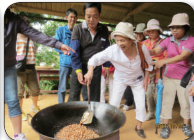
10/4謝姓宗親會，環教影片欣賞、步道導覽、炒花生體驗活動