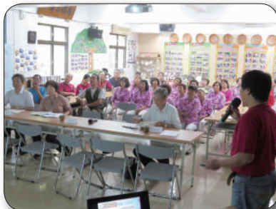
黃月鋁規劃師做簡報