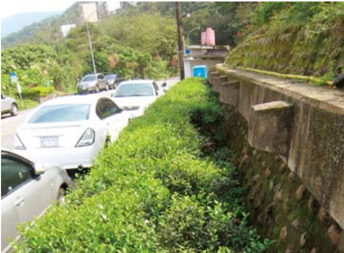
路旁的綠籬不僅能涵養水土，更能間接「去水泥化」。

里辦公處已將中社路列為，林蔭大道計畫，歷經兩年已種植山櫻花兩百餘株，加計翠山里自種存活近一百株，「林蔭大道」可謂已漸成形，假以時日可望顯現成果，兩側樹陰下，惟相對幹道景觀可期，惟相對幹道兩側樹陰下，坡地高低落差崎嶇不平，且雜草叢生，部分路段且有泥土受到雨水冲刷，堵塞水溝的情況，因此，有必要實施進一步的綠美化工程。 里辦公處表示，本案雖未辦入今年預算，但公園處已同意撥發部分經費，先行局部施作。