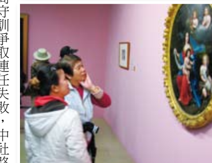
鄉親們參觀特展也感染了藝文氣息