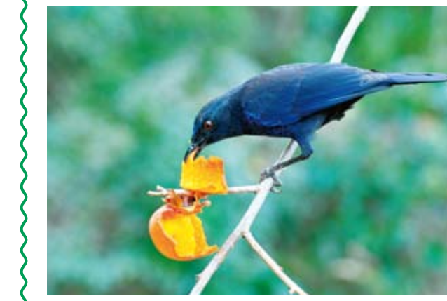
在中海拔山區，台灣紫嘯鸚偶而也會吃日本甜柑「進補」。

【本報訊】很多社區居民都和這種藍藍的、不太怕人的野鳥有過美麗的邂逅。牠們通常成對出現在陰暗潮濕的地面或排水溝附近，偶爾也會跳到圍牆上靜靜地打量你，尾羽上下緩緩張合，氣定神閒得幾分「羽扇綸巾」的味道。可是，當你正想趨前瞧個仔細時，冷不防「激」的一聲長嘯，沒等你回過神，牠早已逃之夭夭！ 沒錯！那正是俗稱「琉璃鳥」的特有種野鳥——台灣紫嘯鸚。本種廣泛分布於台灣全島，從海邊到中海拔山區溪流兩岸都可以發現牠們的蹤跡。野果、昆蟲、蚯蚓、青蛙、魚類、小蛇……等都是牠們日常的餐點，食性寬廣，稱得上是「有毛的吃到糞衣，沒毛的吃到秤錘」。 春、夏兩季是台灣紫嘯鸚的繁殖期。為了覓得佳偶，公鳥半夜三點多就會開始吊嗓子，唱情歌，聲音婉轉而有穿透力。牠們喜歡在屋頂、窗台或雨遮上竄跳，遇到情敵時也會爭風吃醋，拍翅扭打，使得天空前充滿了野性的活力。 文攝 洛桑