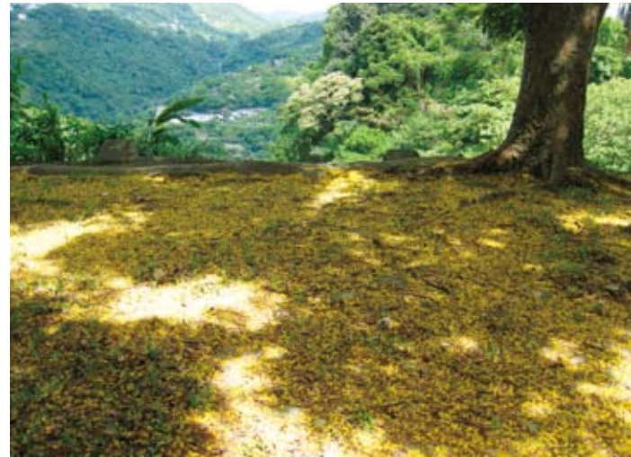
翠山公園的相思花毯，顯示中社路有林蔭大道的潛力。