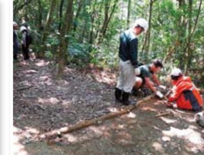
巧妙鋪設樹幹即有導水功能