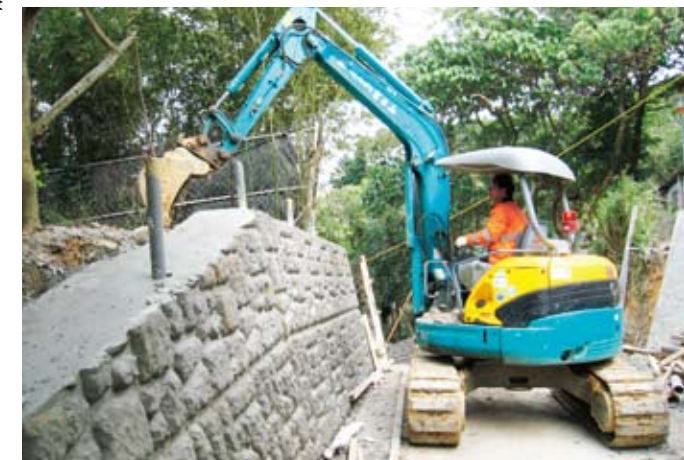
中社路2段35巷內的邊坡強固工程，也已竣工。

【本刊訊】中社路，期八十六號上右側轉彎處，早期風災後邊坡崩塌，泥土覆蓋水溝已近廿年，終在里辦公處努力爭取下，由市府新工處與建坡坎、疏通水溝，已圓滿竣工。 里辦公處指出，社區前曾全面構建、改善排水系統，卻仍有多處水溝旁斜坡泥土，容易沖刷堵塞，上述地點尤為嚴重，幸市府能體察民情予以改善，未來社區發展協會和里辦公處所共同爭取取得的一中社路全線綠美化案「年度建設案」，若能於明年納入預算，則不僅綠美化能夠強化，也能夠解決土壤流失且堵塞排水道的問題。 里辦公處並說明近期社區建設重點如下：