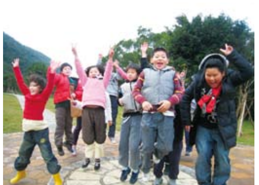
翠山步道已成為國小最佳教育場所。