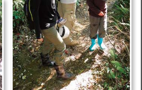
社區民眾亦參與手作步道