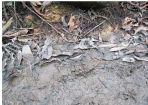
泥濘情況不改善，路旁珍稀植物將進一步受威脅。

【本報訊】士林雙溪中央社區發展協會監事會議，已決議去函敦促市府盡速執行翠山步道第二期工程，藉以完善、發揮休憩功能。 協會指出，里辦公處爭取整理山徑和舊靶場，建設為翠山步道及生態休憩區，經大地工程處高效率的回應民意下，已順利完成第一階段工程。 協會表示，翠山步道完工後，能夠結合大崙頭、大崙尾山區「小溪頭建設」中的石頭地質區、藥用植物區，甚至於延伸至碧山巖附近的白石湖社區等周邊連綿步道，對於市民而言，的確是一項德政。不過，就舊靶場基地而言，既係本里爭取興建，其用途即應結合社區民眾之需求，因此，建議市府盡速強化觀景台、涼亭、鐘錶場、入口處美化等後續設施。 協會強調，里辦公處在進行翠山步道工程時，即堅持不過度開發，並以不破壞環境生態為原則，因此，第二期工程也希望市府依此原則辦理。 里辦公處也表示，山區雨水充足是個常態，第一期工程中保留原泥土路面的路段，由於山友長期的行走，已呈凹陷，故雨後積水、泥濘難行，山友為避水窪，往往踏踏路邊的小毛氈苔等珍稀植物，反而形成生態浩劫，因此，於易積水路段，應進一步改善排水系統，或是鋪上走起來自然、舒服的木屑、樹皮等，以改善相關問題；另外，山友擅自違規搭建的休憩遮棚，規模已愈來愈大，實有礙山林美景，大地工程處依法規早應強制拆除。而為滿足山友之需求，由公部門構建一符合山友休憩、遮雨功能，且結合自然景觀，採用天然材質的棚亭，應是兩全其美的做法。 里辦公處強調，由於天候地形特殊，翠山步道附近有許多中南部在中海拔山區才得見的「北降植物」，市府也可以和環保團體合作，進一步標識或研究相關資訊，俾讓生態遊憩步道名實相副。