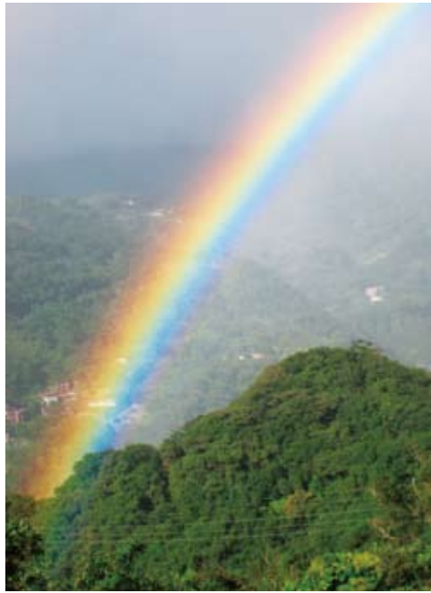
登高觀景台的設置，更能遠眺翠山的美景。