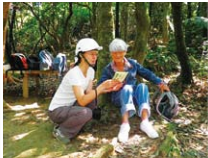
外地民眾也參與觀摩

【本報訊】從二〇〇九年月起，中央社區發展協會和翠山里以領頭羊的角色，與荒野保護協會、千里步道協會和自然步道協會等單位合辦一系列「手作步道」講座、導覽與工作假期等活動方式號召志工參與，獲得廣大迴響。其中並於六月二日在大崙尾山舉辦成果發表，帶領民眾親自用腳體驗手作步道的奧妙之處。 步道之所以促成與政府的合作，起因同樣是因積水導致泥濘、溼滑等問題，山友向當地里長陳情要求改善。在我們分享翠山里步道協同的經驗之後，志工與多位居民深感希望，因此在持續關注之下，里長和議員廣邀居民、環保團體、工程專家和相關單位效法翠山里的形式召開多次的協調會議，結果進行下可能發包的傳統水泥工程，促成以「手作步道」的方式進行步道鋪面改善工程。 承辦單位公證處更表示：「透過志工參與的方式來維護登山步道，不但能增加民眾親山樂趣，也能為政府減少公帑支出。若民眾能接受並支持，我們很希望未來能透過認養等方式，讓「手作步道」推廣到更多郊山步道上。」「手作步道」的特色就在於其能符合路人的需求，針對排水、土壤沖刷或腐爛裸露的部份做處理，來改善泥濘、溼滑等問題，沒有多餘的設施，卻能保留住泥土鋪面，而沿線的生態自然豐富，步道本身與周遭環境融合一體。因此獲得山友、大地工程處與公證處的認同，並且積極合力來推動。 環保團體近期共同發起「水泥石階再見，還我友善步道」活動，希望能夠整合民間力量，共同監督台北市與新北市郊山的步道工程，不讓危害山林生態環境的水泥石階步道工程再次興起，並改以自然的建造方式維護郊山的自然環境。