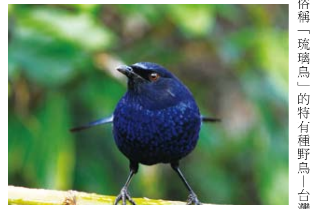
有人盛讚台灣紫嘯鸚是「溪流的魂魄」。