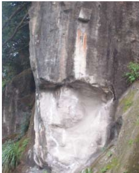
發現，除了近年來社區雕塑家所借展的藝術作品

的自然界。只要您駐足，您就可能發現叫鱗藤，開簇狀小黃花，靠近種子（如圖一），不但造型實（時尚）；至於在觀景欄上就是可愛的茶科灌木，民間稱碎米蕒（圖二），花型如小鈴鐺，扁圓粉卻都是白色，是民間蜂蜜（米花蜜），可是產藥極品。至於「藍寶石」比較顯眼，上期會訊所介紹的圓葉雞屎樹，色，就是要吸引最喜歡吃它的竹，而一整片的（天線寶實）的嫩光，中葉白的（如圖四）的嫩高海拔才得見的植物，卻因為尾低海拔山區，是很特殊而珍貴，最令人驚訝的則是，漂亮的月才看得到，秋冬之交也看得起影！