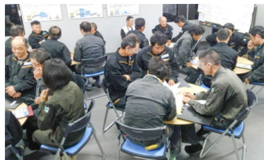
社員透過研修課程，意識自己在環保上的貢獻，找回自信。

企業的參與，是打造可持續發展社會網絡的重要力量之一，常激盪出驚喜。一如富士清潔公司對自我的重新定義：「我們有卓越的廢棄物處理技術，我們是對地方繁榮有貢獻的企業，是創造環境價值的企業！」底氣油然而生，也掙得自己的尊嚴。