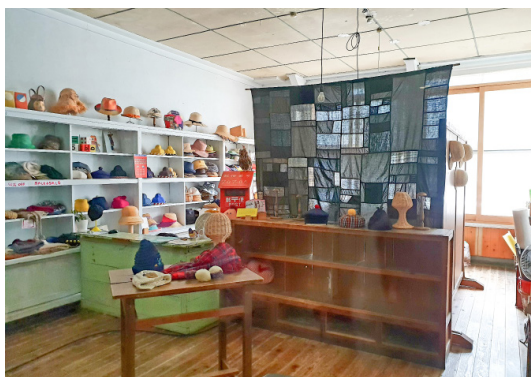
西粟倉村吸引對鄉居生活懷抱夢想的人前來創業。圖為進駐舊影石小學、深受歡迎的帽子店。

年森林」計畫，隔年，正式推動。第一步是透過間伐，讓留存的樹可以成長茁壯。西粟倉村提出「森林管理協定」，由地主、公所、森林組合三方簽訂長達10年的契約，由公所負責管理、森林組合負責間伐，而地主無