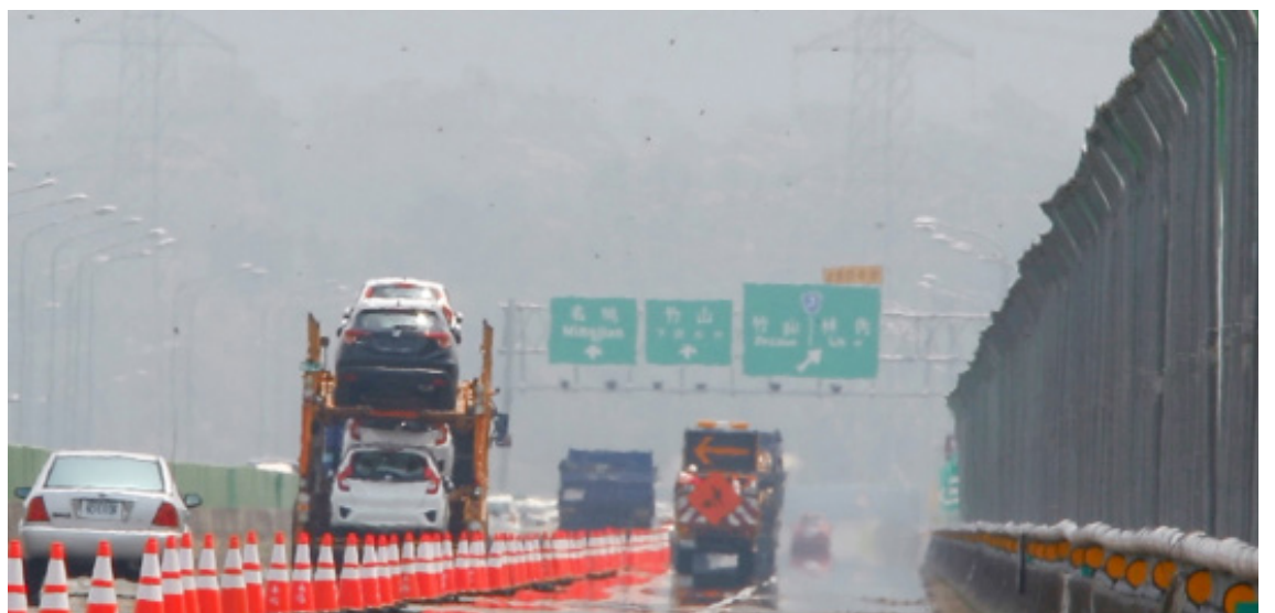
「國道讓蝶道」，紫斑蝶飛越護網流量每分鐘超過 250 隻時，高公局即封閉部分車道，守護牠們安全通過高速公路。

在台灣，最早因為學者、志工的投入，紫斑蝶北返蝶道之謎逐漸引起國人的注意，交通部高速公路局也積極參與紫斑蝶遷移的保育工作，1997 年有了「國道讓蝶道」的創舉：