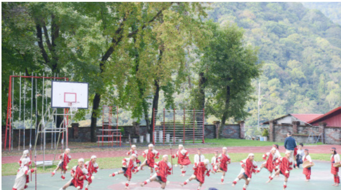
位於南投縣仁愛鄉的都達國小，居民以賽德克族為主，深具山林子民的活力。

位於南投縣仁愛鄉的都達部落，舊稱平靜部落，2014年自精英村分村後，始正名為「都達」。部落人口七百多人，以賽德克為主要族群。