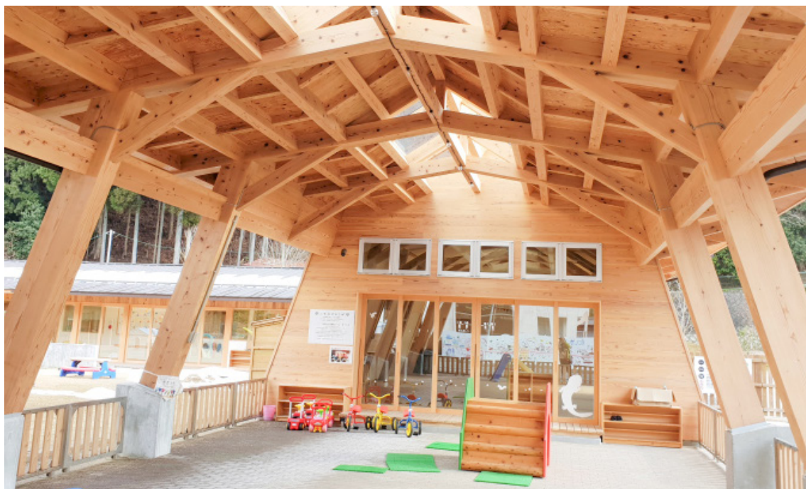
從拒絕合併，到走出自己的路，西粟倉村成為地方創生的範例，要打造充滿活力又快樂的村莊。

村創業的理由。入選者可獲得 3 年基本生活費的保障、村公所也會媒介創業空間和銀行的貸款。