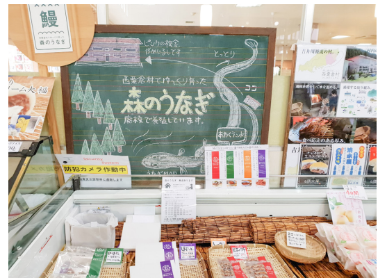
(上圖)10年有34家公司在此創業，新移民帶來新創意，也帶動地方產業振興。(下圖)利用舊影石小學體育館所飼養的鰻魚產品，在西粟倉道之驛超市展售。