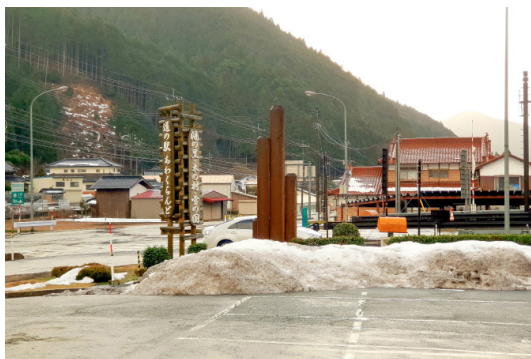
森林區佔95%的西粟倉村，從各項間伐材產品的開發，找到產業新契機。