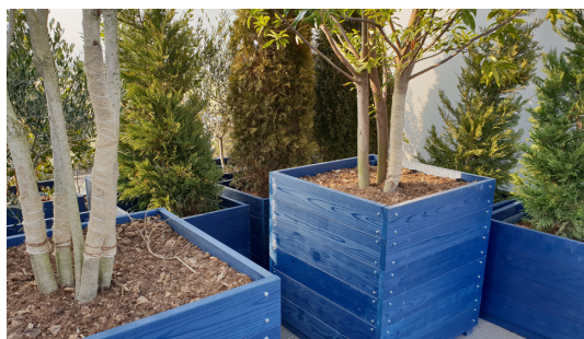
富士清潔公司用再生土壤製成的培養土，可供植栽用。

透過 ESD 的支持，社員從 2018 年元月起，每月在專家學者指導下參加 ESD 研習會，初期目標是希望 10 月可以帶家人參觀自己工作的地方，並由社員自己做導覽。