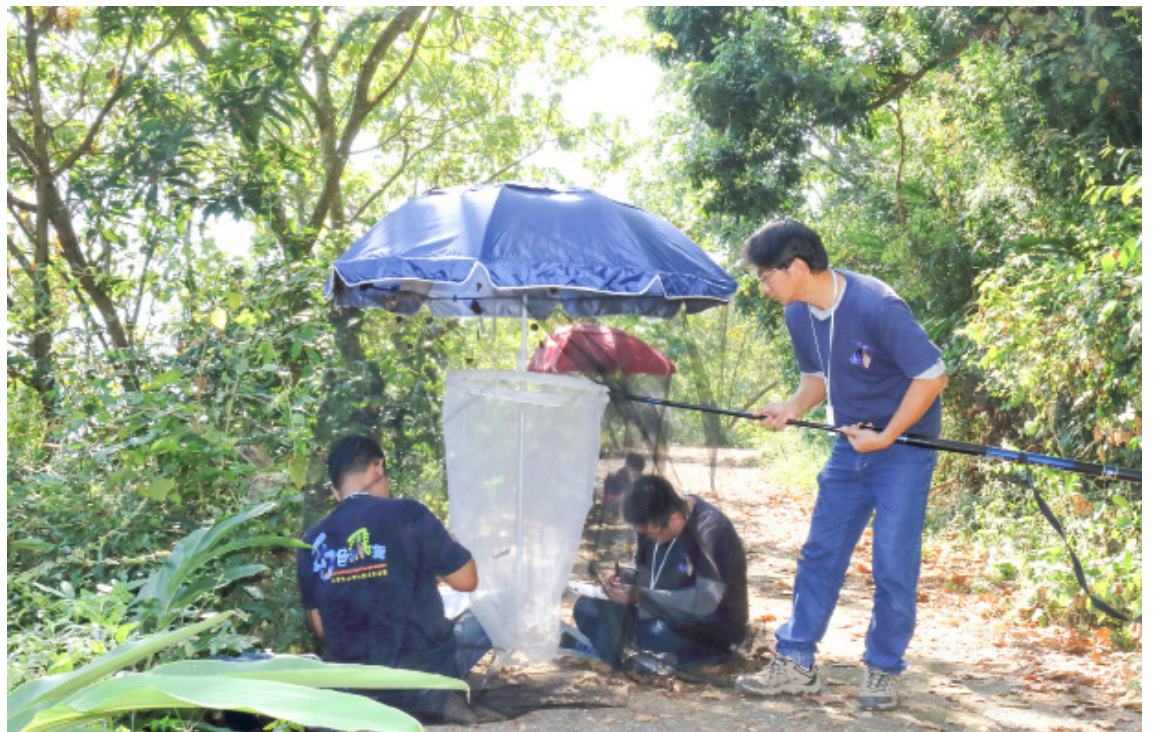
「標記」是找出紫蝶遷移路徑、記錄其生態的有效方法，圖為標放的情形。

※掃描QRcode可參考台灣紫斑蝶生態保育協會網站，了解更多相關保育及活動資訊。