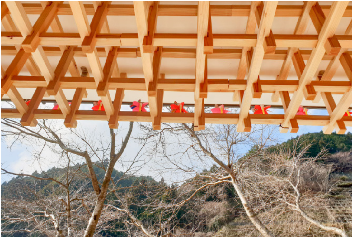
西粟倉村透過「百年森林」計畫，以林業的再生，為地方創造新機。