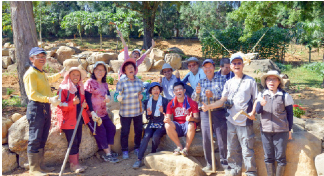
熱情的夥伴們，一起為老樹公園種下蜜源食草，營造蝴蝶夢。

有 20 年種植老樹經驗的他，照顧起蜜源食草來易如反掌，「老樹就像已成年的孩子，不用多照顧，而食草、蜜源就像新生兒，須要多點心力、多點水去灌溉。」提到目前食草、蜜源的生長狀況，他自信地說長得很好！連指導的彭國棟老師都誇：「長得不錯，有在用心喔！」當天一起種植的夥伴們，也