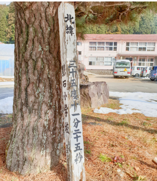
廢棄的舊影石小學，是「森林學校」株式會社的創立地點，也是產業活化的據點。