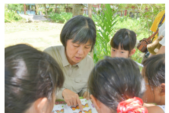
素敏對孩子耐性十足，引領他們深入生態世界。

回首近9年的學習，從家庭到投入生態教育的公共領域，素敏自我期許：「要當個快樂幸福的解說員！讓更多人看見生態對人類的影響，一起愛地球、守護土地！」 *