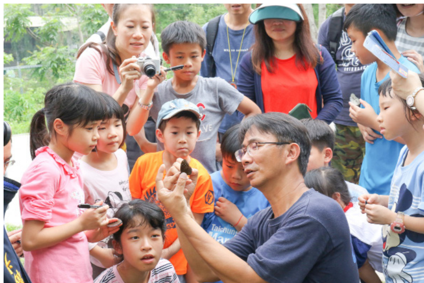
透過生態教育，傳揚保育的理念。

成東部、南部的大型蝶谷嚴重受損、政府善意鼓勵造林卻變相成為伐木造林、西部的斯氏紫斑蝶棲地羊角藤被砍掉、為推動觀光迎合民眾需求進行水泥化工程……等等，都是原因。