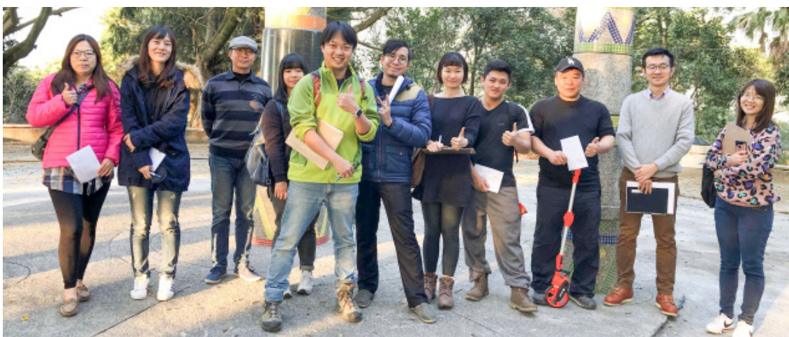
埔里青年團隊的能量，促發一場深具質感的逐燈祭活動。

感謝所有投入這場活動的戰友。一日限定、一夜閃耀的埔里森林逐燈祭像個小天使，至此已經深深的住進埔里人的心中，願我們台灣之心，永遠美麗。 *